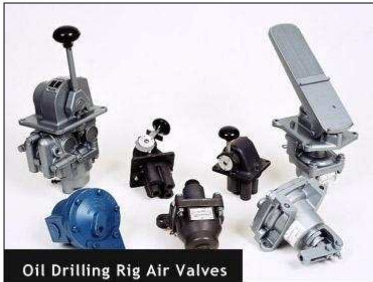
Oil Drilling Rig Air Valves

Clutch, Brake & Throttle Control Valves Repair Kits Service/Parts Information